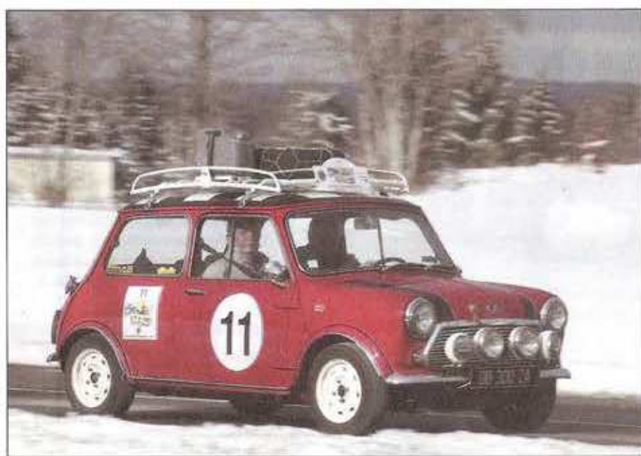
◀ Guy Pouligny a amélioré l'éclairage sur sa Mini Cooper 1000 !