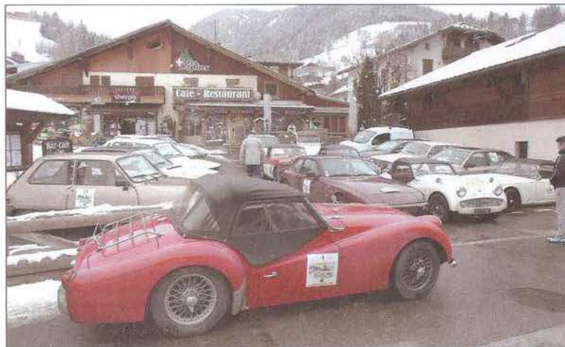
◀ Située à côté de Megève, la station de Praz-sur-Arly a accueilli le rallye le dernier jour.