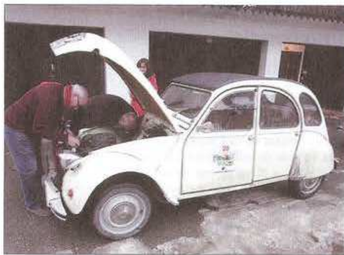
Après avoir renoncé avec sa 2 CV de 1963, Yves Point resserre les écrous de cardan de la 2 CV 4 de Jacques Lemerclier à Morzine. ▶

du Jura. Avec peu d'indications, les navigateurs, souvent peu expérimentés, doivent doubler de vigilance pour trouver la bonne direction. Dans cette contrée très rurale et froide, les panneaux ne sont pas nombreux, les CP (contrôle de passage) et CH (contrôle horaire) pas toujours visibles. Même si les moyennes sont basses (37,736 et 32,412 km/h), les conducteurs doivent cravacher sur des routes glissantes, surtout ceux qui sont engagés avec de petites cylindrées.