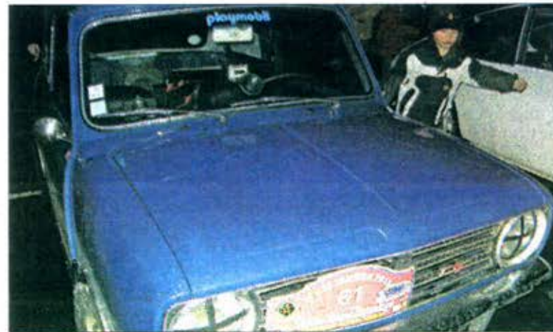
■ Les Austin étaient particulièrement bien représentées dans cette 18 e édition. Ici une 1275 GT "customisée" aux couleurs de Playmobil...