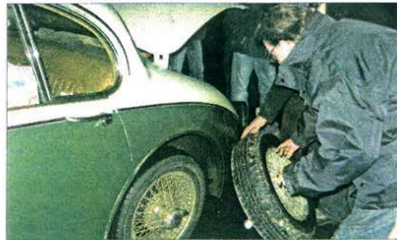
■ Mauvaise surprise à l'arrivée pour cet équipage qui a dû changer sa roue cours d'Angoulême avant de pouvoir profiter d'un repos au chaud.