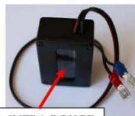
LEDs INFRA ROUGE

Ce transpondeur doit être alimenté par la batterie 12 V de votre véhicule.