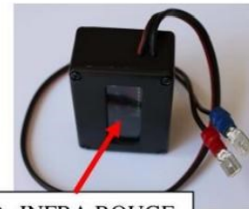
LEDs INFRA ROUGE

Ce transpondeur doit être alimenté par la batterie 12 V de votre véhicule.